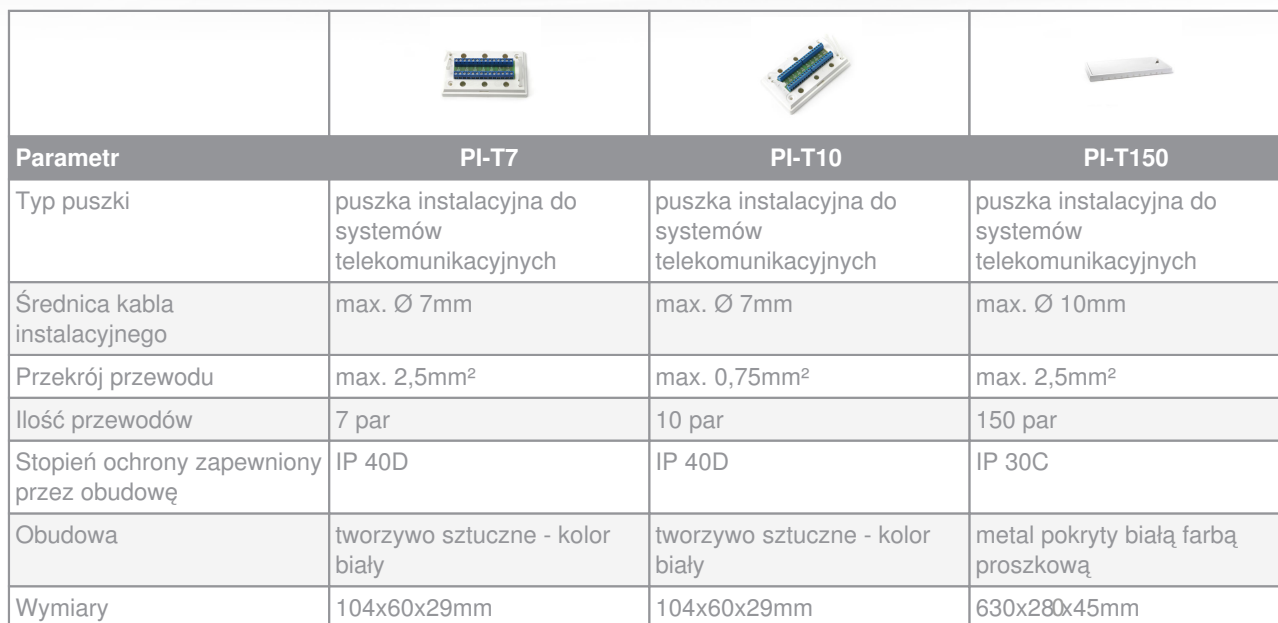
Tabela porównawcza Puszki uniwersalne serii PI-T