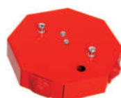
PIP-1AN/0,375A LUB PIP-3AN/0,75A