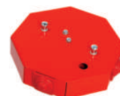
PIP-1AN/0,375A LUB PIP-3AN/0,75A